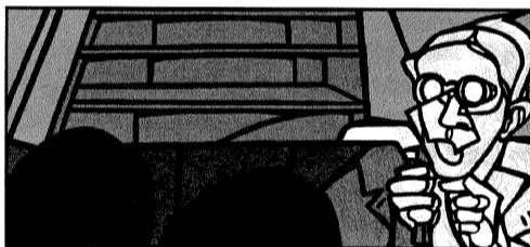
Poster for the 2008 FIPA. A self portrait?