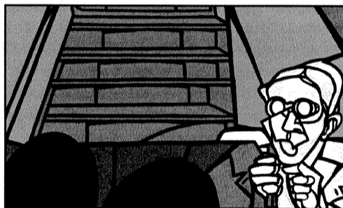
L'affiche du FIPA 2008. Autoportrait ?