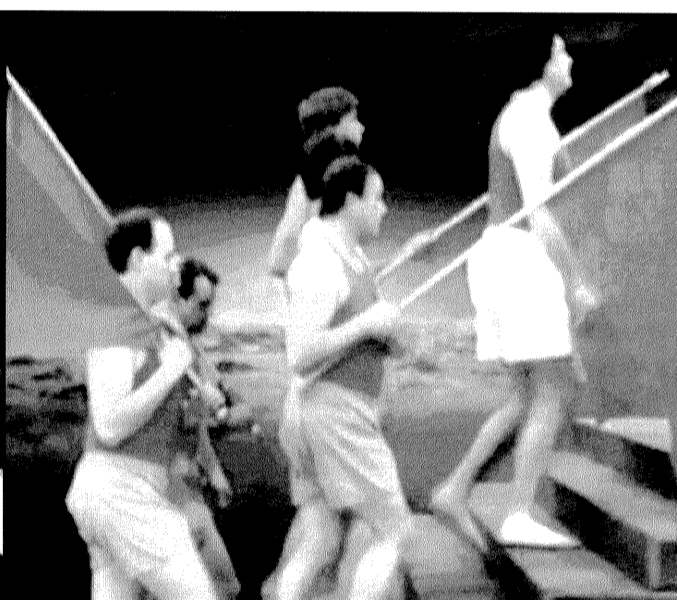
Si c'est toujours le même thème qui se répète inlassablement, l'engouement pour l'oeuvre de Ravel reste intact. Au son du Boléro, les corps s'emballent.