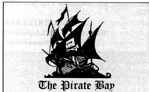
La houleuse question du téléchargement n'est pas résolue